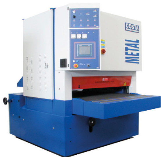
图2：金属加工处理机